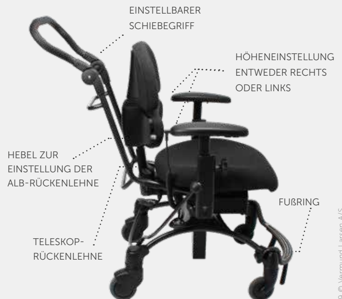
VELA Tango 500EI mit Zubehör

Das Besondere an der ALB-Rückenlehne ist, dass die Muskelgruppen in der Lumbal-, Becken- und Bauchregion aktiviert werden was die Korsettzone stärkt und so zu einer besseren Haltung führt.