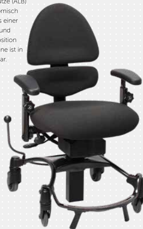
VELA Tango 500E mit mittlerer ALB-Rückenlehne

(Der Fußring kann separat geordert werden)