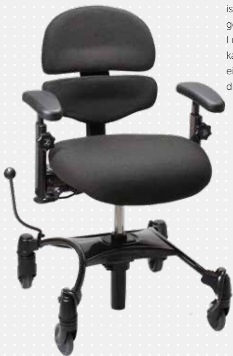
VELA Tango 500 mit kleiner ALB-Rückenlehne

Die Rückenlehne mit aktiver Lumbalstütze (ALB) ist eine einzigartige zweiteilige, ergonomisch geformte Rückenlehne. Sie besteht aus einer Lumbalstütze und einer Rückenstütze und kann individuell auf die optimale Sitzposition eingestellt werden. Die ALB-Rückenlehne ist in drei unterschiedlichen Größen verfügbar.